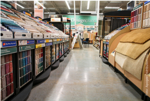
Home Depot Fort Myers, FL USA