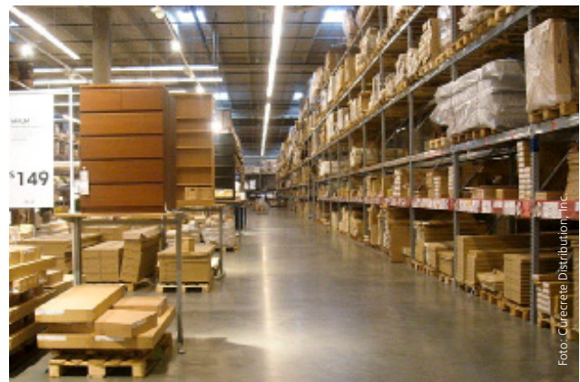
IKEA Elgin, IL USA 19.000 m 2 , 2004