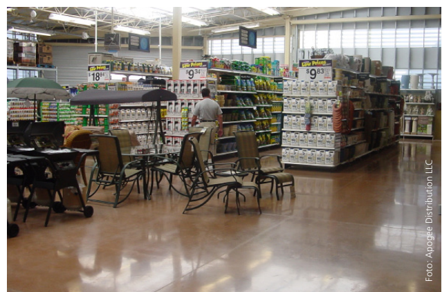
Wal-Mart Supercenter (Gartencenter) Tampa, FL USA